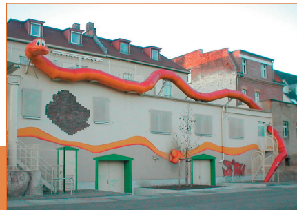
Rückansicht des Vereinsgebäudes am Henriettenpark

Bank für Sozialwirtschaft Leipzig Konto-Nr. 35 149 01 BLZ 860 205 00