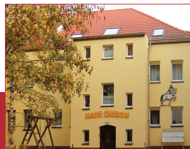
Eingang vom HAUS CHIRON

Bank für Sozialwirtschaft Leipzig Konto-Nr. 35 149 02 BLZ 860 205 00